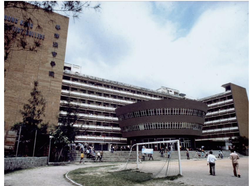
1974至1976年的學院大樓和謝再生紀念館

1976年，位於林子豐紀念大樓低層的呂明才圖書館啟用；原有位於學院大樓二樓的富蘭明圖書館，則改為參考圖書館。1977年，基督教教育中心落成啟用，樓高七層，一樓是可容四百餘座位的禮拜堂。1978年5月19日，大專會堂內部裝置完成，由港督麥理浩爵士（Sir Murray MacLehose）主持開幕典禮，學院並為此舉行了一個