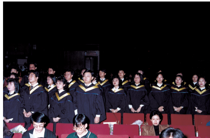
1989 年首批學士學位畢業生結業

位課程，包括綜合科學理學士（榮譽）學位及社會工作學士學位。1987 年，開辦第二批學士學位課程，包括工商管理學士（榮譽）學位及傳理學社會科學學士（榮譽）學位。1988 年 6 月，立法局通過《1988 年香港浸會學院（修訂）條例》，明確規定浸會學院頒授的學術及榮譽學銜，包括學位及榮譽學位。同年，學院開辦第三批學士學位課程，即文學及社會科學文學士（榮譽）學位。