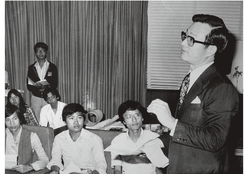
1978年謝志偉校長向記者及傳理學系學生解釋「2+2+1」制

這份《白皮書》發表之後，受到教育界的普遍歡迎。謝志偉校長在翌日召開一個記者招待會，表示浸會學院的師生對《白皮書》的反應是良好的，大都認為在相當程度上可以接受，他在會上並對「2+2+1」新制作了闡釋。然而學院內也有意見認為《白皮書》仍存在一些不合理的地方，學生會及各系會就這份《白皮書》的專上學院部分發表聯合聲明，指出「2+2+1」制缺乏連貫性，而畢業生的資格也未夠明確。 7