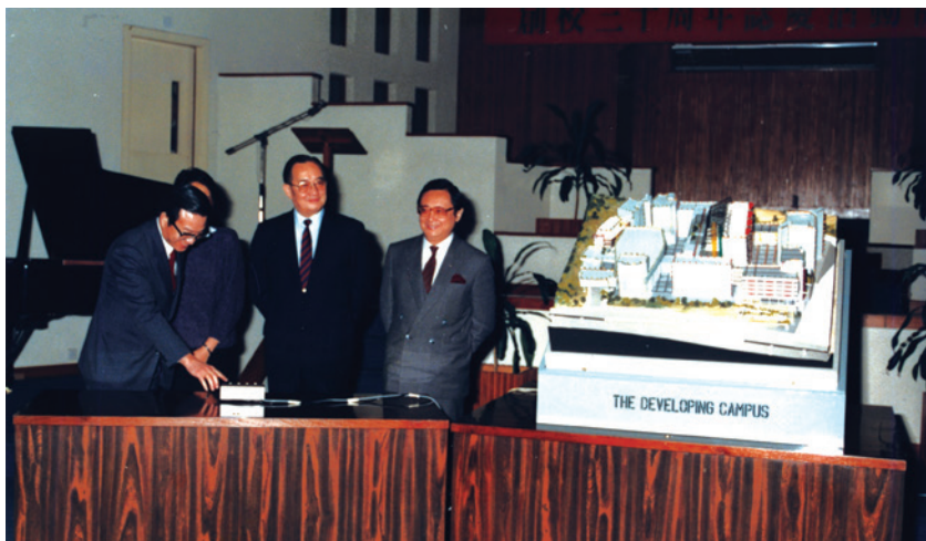
1980 年代中期校園擴建的模型