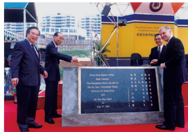
1993 年逸夫校園奠基禮

商管理學院的學系結構，設會計及法律學系、財務及決策學系、經濟學系、市場學系、管理學系，原有的人力及資源管理學系歸納於管理學系之內。社會科學院則於 1989 年 9 月設立教育學系。1991 年 9 月，傳理學系升格為傳理學院，成為浸會學院的第六個學院，包括電影電視系、新聞系和傳播系。1992 年 7 月及 1994 年 9 月，先後成立隸屬社會科學院的體育學系、政治及國際關係學系。