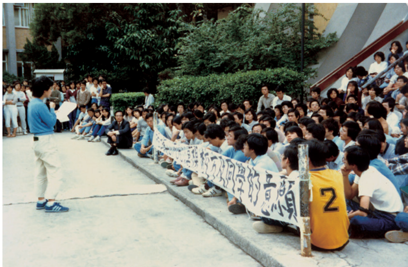
1982 年土木工程學系師生靜坐