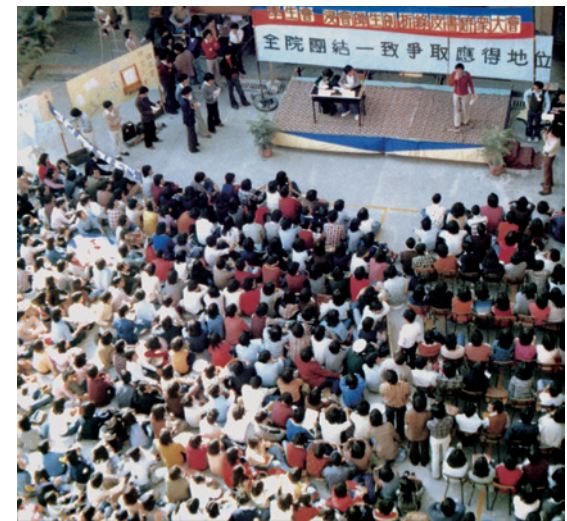
1977年12月19日的「《綠皮書》日」

《綠皮書》將認可私立專上學院的地位，界定於中學六年級的高級程度與大學學位之間，而藉以作為論據的，是認可專上學院畢業生受聘於政府職位時所獲的起薪額和私人企業所評定的市場價值；又將香港浸會學院和樹仁學院兩間認可專上學院的辦學理想與香港理工學