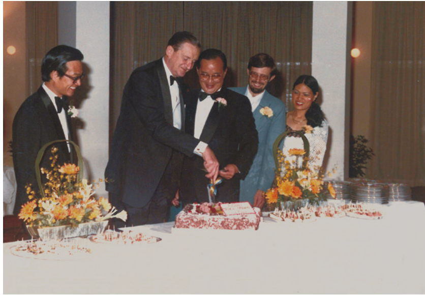
港督麥理浩爵士主持大專會堂開幕典禮

盛大晚會。在此後一段時間，大專會堂除了供學院使用之外，還開放予外界團體租用，成為香港一個重要的文娛表演場所。1980年，紹邦樓（行政中心及校長寓所）、校園正門的牌樓及區樹洪花園相繼落成；翌年星島傳理中心啟用，學院自此更具規模。