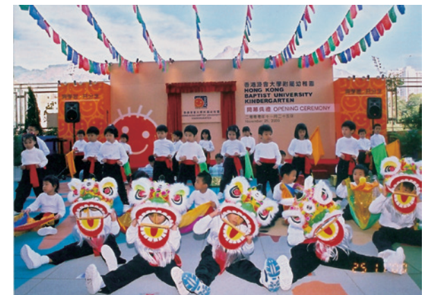
2000年香港浸會大學附屬幼稚園開幕典禮

謝志偉校長於2001年中退休，在他任內另一件值得注意的事，是於1999年重新訂定香港浸會大學的使命，強調大學對學術自由、自主及對德性修養的追求。謝志偉博士由1971年起擔任校長，三十年間為大學勞心勞力，包括爭取學院地位和正名為大學等，建樹良多。如果說，林子豐校長任內是浸會大學的開創期，那麼謝志偉校長任內，就是浸會大學的成長期。其後吳清輝校長任內的九年，可以說是浸會大學在林校長和謝校長時代奠下的基礎上繼續深化、扎根及開拓的發展期。