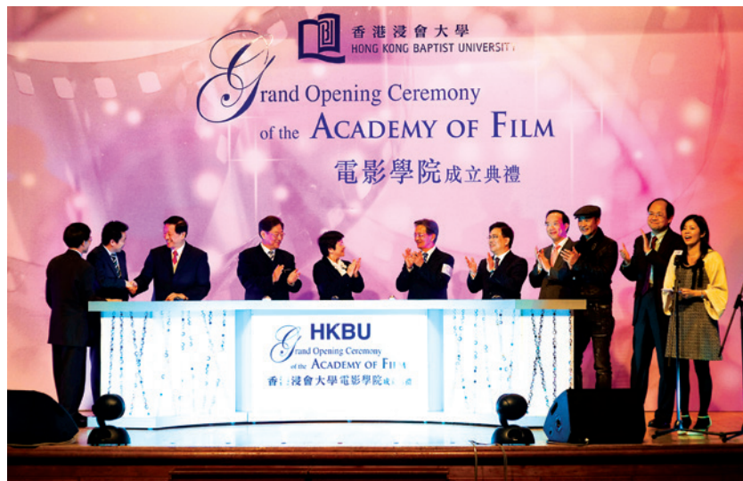
2010年電影學院成立典禮

2010年6月11日，浸會大學在香港會議展覽中心舉行「敦學崇禮·圖強惟新·吳清輝校長榮休晚宴」，歡送服務浸大二十五年、出任校長九年的吳清輝教授。稍後，吳校長於6月18日主持傳理視藝大樓及顧明均展覽廳的命名典禮，該大樓是「校園總體發展規劃」的第一部分，展覽廳位於大樓的地下及一樓，主要供視藝學院師生展覽作品之用。