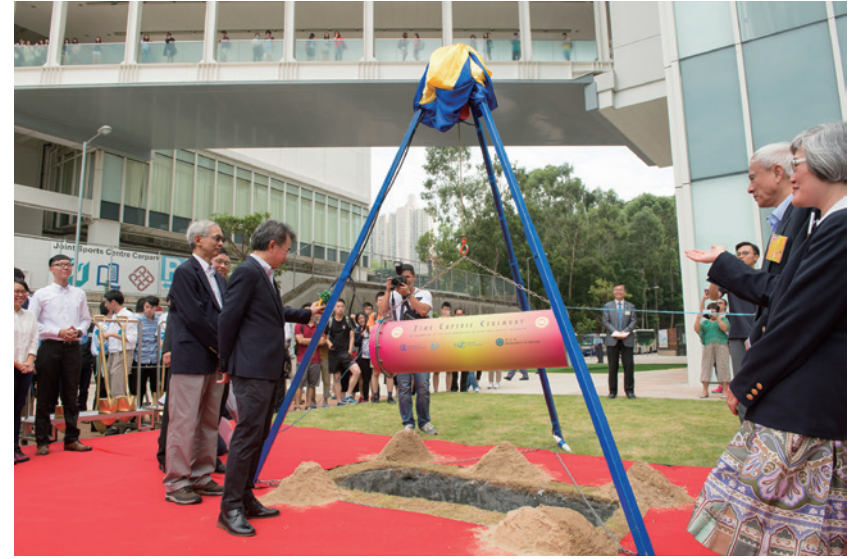
歷史系於 2016 年 10 月 5 日舉行「百年時間囊封存典禮」，以慶祝浸大六十周年校慶暨社會科學院成立四十五周年。