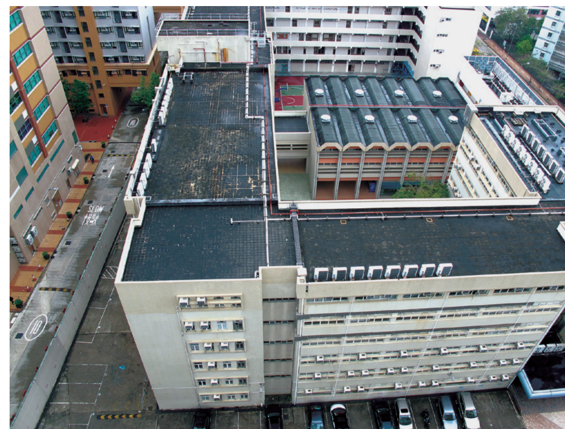
前李惠利校舍北面用地將會興建學生宿舍及教學綜合大樓

宿位的學生宿舍。除了提高本地同學參與舍堂生活的機會，宿位增加還有兩大好處。其一，可以吸收更多外地同學和交換生到浸大就讀，使得整體浸大同學的學習經驗添加國際化的元素。其二，有利於更多本地同學參與海外大學生的交流，因為大學之間的交換計劃大多以「數目對等」的原則運作，能多接納海外交換生就意味着本校學生有更多到海外大學作交換生的機會。錢校長尤其重視宿舍內學習空間的設計，着意為創意學習營造更理想的條件。