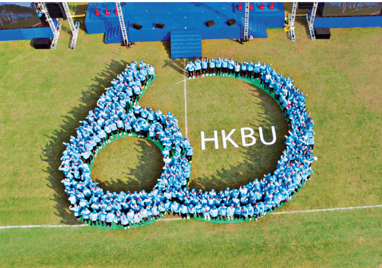
參與浸大六十周年校慶開幕典禮的主禮嘉賓、浸大前任及現任校長、學生、教職員及校友等三百多人砌出六十周年校慶標誌。