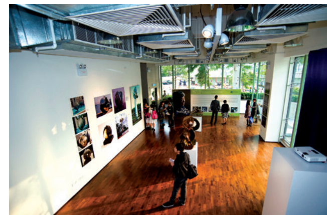
傳理視藝大樓及顧明均展覽廳