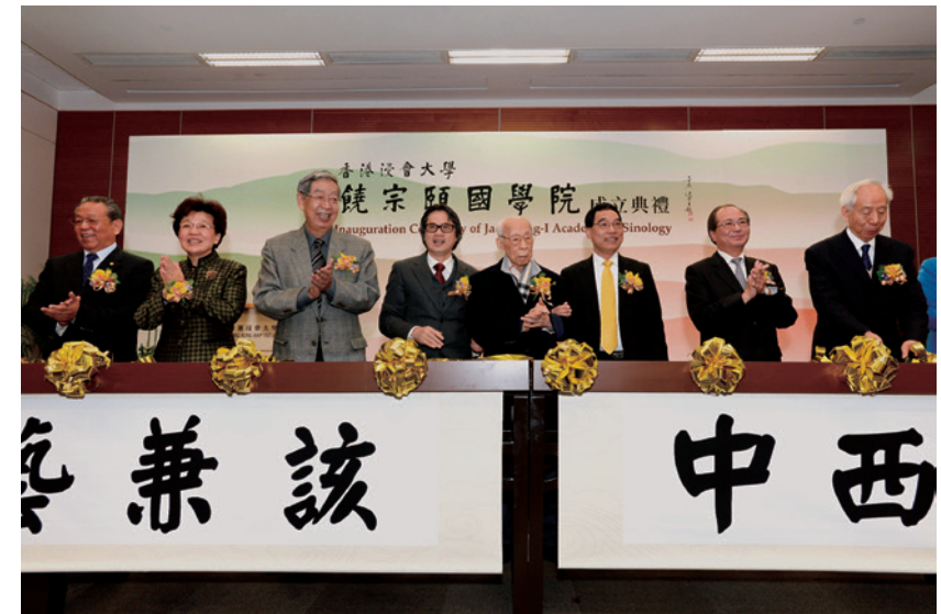
2013年大學創立饒宗頤國學院