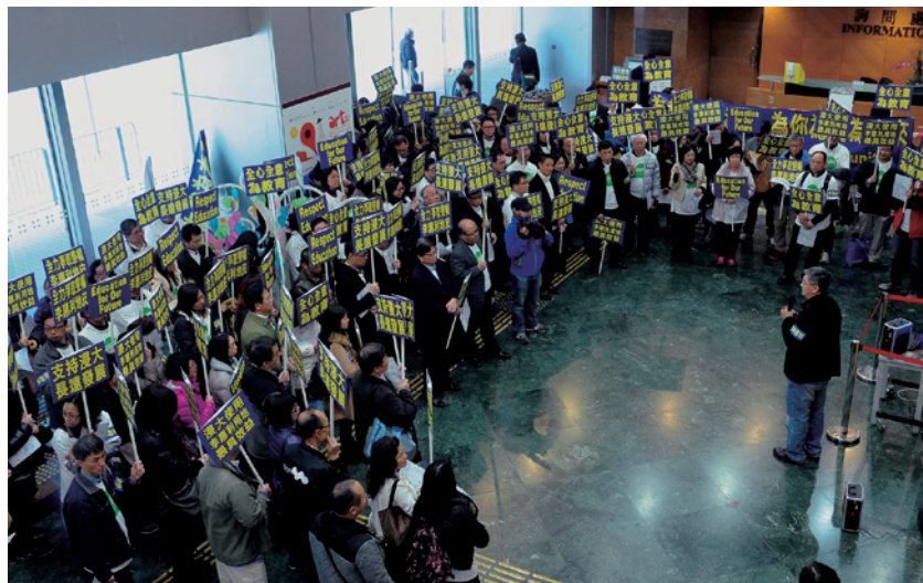
2014年「爭取李惠利用地行動組」向城規會遞交四千多張願望心意咭

2014年6月，浸大校董會宣佈接納陳新滋校長於2015年6月30日五年任期屆滿後退休的決定，並將成立聘任委員會，全球招聘新校長。同年，大學修訂了於2010年制訂的《2020年願景》：使命是「香港浸會大學在教學、研究及社會服務等範疇力臻至善，秉承基督教高等教育的理念，推行全人教育」；願景是大學將於2020年成為區內全人教育的領袖學府，於學術上表現卓越，力求創新；至於策略發展重點方面，浸大將充分結合「高質素教與學」、「創新研究」及「社區互連」三大策略發展重點，以達致大學願景。為配合大學的未來發展，校方制訂了「校園總體發展規劃（二）」，當中包括四個主要元素：第一，建議基本工程項目；第二，重新規劃空間；第三，改善／提升設施；第四，具發展潛力的項目。從《2020年願景》和相應的校園總體發展規劃，可以預見浸會大學進入第二個甲子之後的趨向。