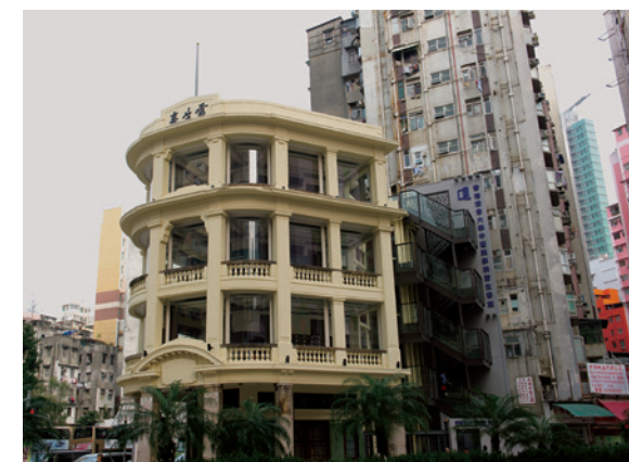
賽馬會創意藝術中心和香港浸會大學中醫藥學院—雷生春堂成為大學第二及第三個活化計劃