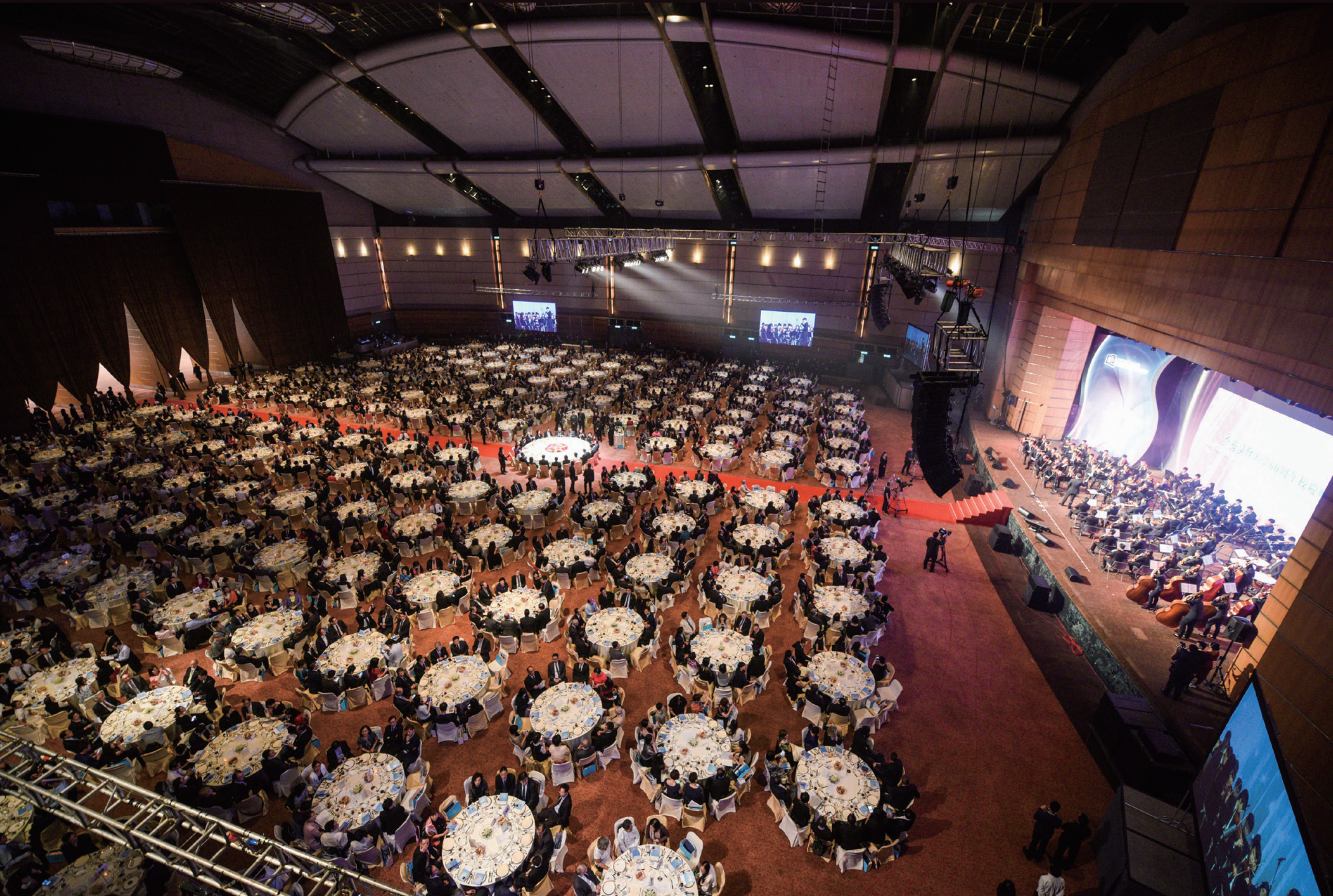
浸大六十周年校慶晚宴於 2016 年 10 月 4 日舉行，出席賓客達兩千多位，盛況空前，為全年的校慶活動掀起高潮。