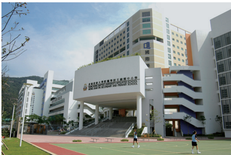
(上) 用作視覺藝術院的啟德校園