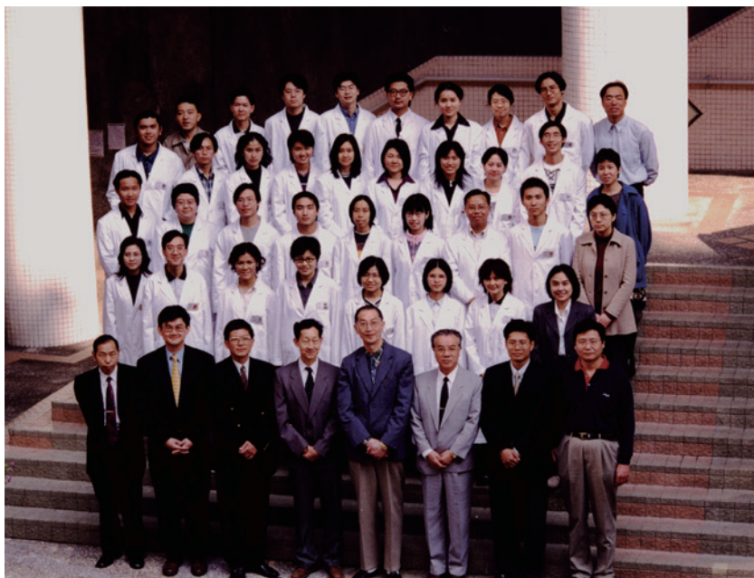
1998 年首屆中醫本科生課程的師生合照

1997 年 1 月，教資會正式批准浸會大學開辦中醫學學位課程；3 月，中醫藥研究所成立，並於 10 月與清華大學、北京中醫藥大學簽訂五年合作協議，共同推行多項研究計劃。同年 11 月，浸會大學與香港浸信會醫院（以下簡稱「浸會醫院」）合作，開辦中醫藥診所，設於浸會醫院區樹洪健康中心。浸會大學的中醫藥專業教育中心，亦於是年成立。