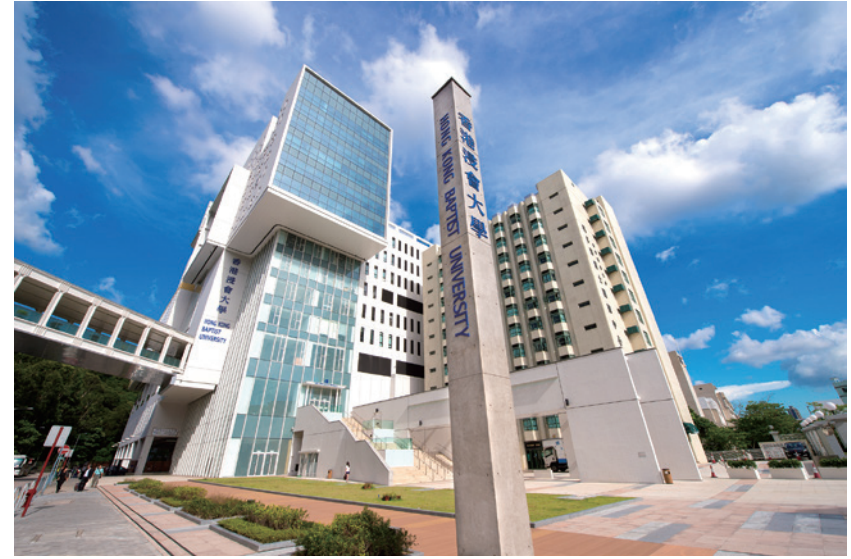
浸會大學道校園入口廣場